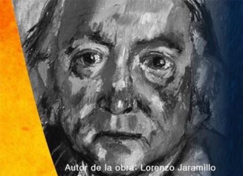
Autor de la obra: Lorenzo Jaramillo